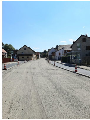
ein seltener Anblick