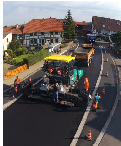
jetzt wird geteert..

Am 27.8. fast schon ein Deja vu aus dem Vorjahr. Ein kurzer besonders heftiger Regen fiel auf Hilkerode. Desmal gab es hier keine Schlammlawine. Allerdings konnten das unsere Nachbarn aus Rhumspringe nicht sagen. Dort liefen zahlreiche Keller unter Wasser.