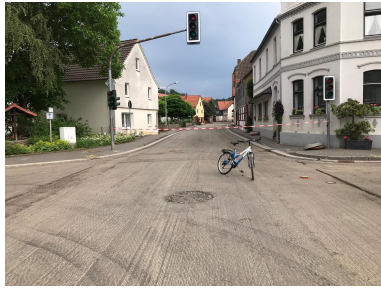
.....einsam und menschenleer