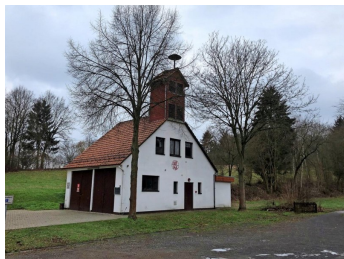
unser altes Feuerwehrhaus

Am 21. Oktober war es soweit. Unser altes Feuerwehrhaus wurde abgerissen. Nach gefühlten ewigen Vertröstungen bekommt Hilkerode einen neuen und modernen Standort. Wir haben nun einmal ein schlagkräftiges und einsatzfähiges Kommando, und dieser Truppe gilt es ein Heim zu geben.